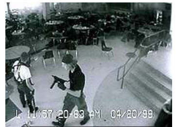
コロンバイン高校銃撃事