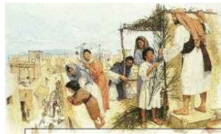
スコテ(仮庵)の祭りの準備